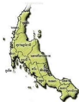
การตั้งเมืองบริเวณที่ราบลุ่มแม่น้ำในภาคใต้

จากหลักฐานที่พบในดินแดนประเทศไทย แสดงให้เห็นว่าการตั้งหลักแหล่งในดินแดนประเทศไทยมีมาตั้งแต่สมัยก่อนประวัติศาสตร์ ซึ่งต่อมาได้รวมตัวกันเป็นชุมชนและเจริญขึ้นเป็นเมืองในเวลาต่อมา เมืองต่าง ๆ เหล่านี้ส่วนใหญ่ตั้งอยู่บริเวณริมแม่น้ำ และบริเวณที่มีการคมนาคมติดต่อกับดินแดนอื่น ๆ ได้สะดวก มีการค้าขายกับดินแดนภายนอก มีการแลกเปลี่ยนทางวัฒนธรรม เมืองหลายเมืองในดินแดนประเทศไทยได้เจริญรุ่งเรืองขยายตัวขึ้นเป็นอาณาจักรได้ในเวลาต่อมา