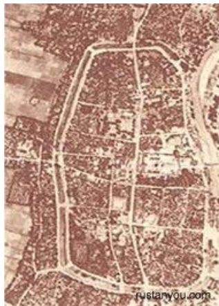
ภาพถ่ายทางอากาศของเมืองคูบัว จังหวัดราชบุรี เมืองโบราณที่ตั้งอยู่บริเวณลุ่มแม่น้ำแม่กลอง

จากหลักฐานรูปถ่ายทางอากาศ พบว่ามีการตั้งชุมชนเป็นหมู่บ้าน และเมืองที่มีคูน้ำ คันดินล้อมรอบเป็นจำนวนมากตามบริเวณที่ราบลุ่มแม่น้ำสายสำคัญ เช่น แม่น้ำแม่กลอง แม่น้ำท่าจีน แม่น้ำลพบุรี แม่น้ำป่าสัก เมืองที่สำคัญในภาคกลางและภาคตะวันตก ได้แก่ เมืองนครปฐมโบราณ จังหวัดนครปฐม เมืองคูบัว จังหวัดราชบุรี เมืองชัยจำปา จังหวัดลพบุรี เมืองอู่ทอง อำเภออู่ทอง จังหวัดสุพรรณบุรี เมืองจันเสน อำเภอตาคลี จังหวัดนครสวรรค์ เมืองพงตึก จังหวัดกาญจนบุรี เมืองเหล่านี้มีเส้นทางเดินเรือออกทะเลได้สะดวกจึงมีการติดต่อค้าขายกับดินแดนอื่น ๆ ที่ห่างไกลได้ และรับอารยธรรมความเจริญจากภายนอกดินแดนมาผสมผสานกับของตนเอง